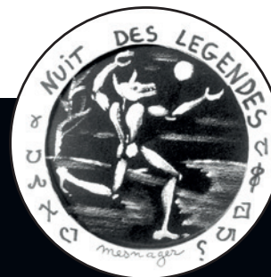
Logo de l'association Nuit des Légendes, créé par Jérôme MESNAGER

président de l'association Nuit des Légendes