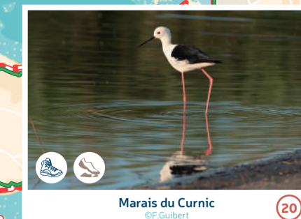
Marais du Curnic