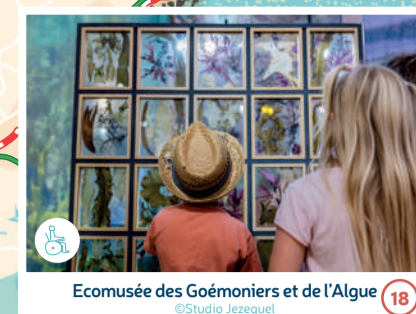
Ecomusée des Goémoniers et de l'Algue