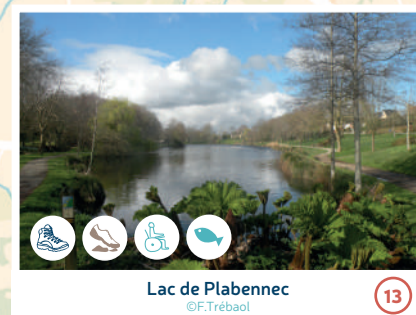
Lac de Plabennec