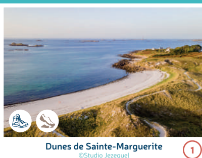
Dunes de Sainte-Marguerite