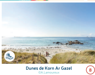
Dunes de Korn Ar Gazel

PAYS D'ROISE PORT DU CONQUET EMBARQUEMENT OUESSENT - MOLÈNE PHARE ST-MATHIEU PHARE DE KERMORVAN PHARE DE TRÉZIEN