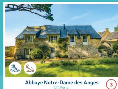
Abbaye Notre-Dame des Anges