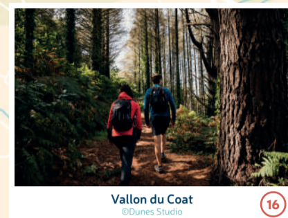
Vallon du Coat