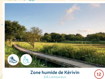
Zone humide de Kérivin