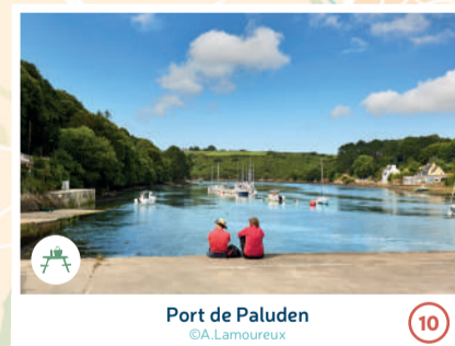
Port de Paluden