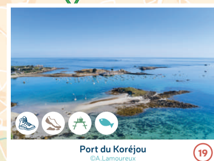
Port du Koréjou