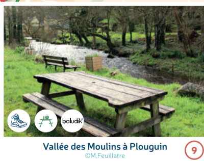
Vallée des Moulins à Plouguin