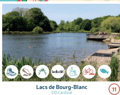
Lacs de Bourg-Blanc