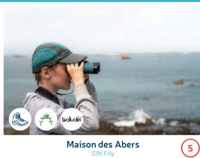
Maison des Abers