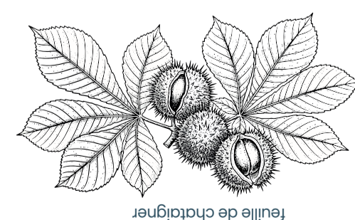
feuille de châtaignier