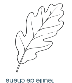
feuille de chêne