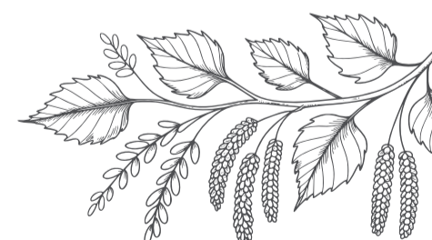
feuille de hêtre