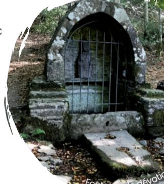
Fontaine de dévotion à Saint-Conval

Elle s'étend sur les territoires communaux du Faou, d'Harvec et de Loperec. Sa superficie est de 625 hectares répartis en 54 parcelles dont un arboretum de 11 ha.