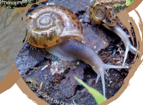
Escargot de Quimper