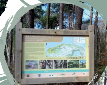
Bois du Loch - Landévennec

Elle abrite également des espèces remarquables telles que l' Autour des palombes , Accipiter gentilis , une dizaine d'espèces de chiroptères et au niveau floristique le piment royal , Myrica gale , petit arbuste et une fougère protégée au niveau européen Dryopteris eamula .