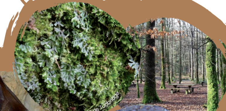
Hyménophylle de Tunbridge

Des chênes vieux de 240 ans peuvent être vus au Pont Rouge. Cette forêt abrite des espèces protégées autant au niveau de la flore, Hyménophylle de Tunbridge ( Hymenophyllum tunbrigense ) que de la faune avec la présence de Grand rhinolophe ( Rhinolophus ferrumequinum ) et d' Escargot de Quimper .