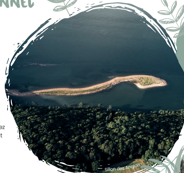
Sillon des Anglais

Le GR 34 en parcourt une grande partie du pont de Térénez jusqu'à l'anse du Loch et permet de découvrir notamment le cimetière des bateaux de la Marine ainsi que les sites du sillon des Anglais et du Loch appartenant à la Réserve naturelle de la Presqu'île de Crozon.