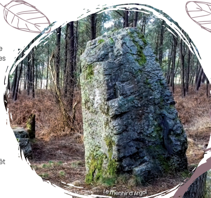
Le Menhir d'Argol

L'enjeu est important : protection en eau potable (3 captages), site d'escalade du rocher du C'hleguer avec son point de vue, parcours santé et divers sentiers de randonnées.