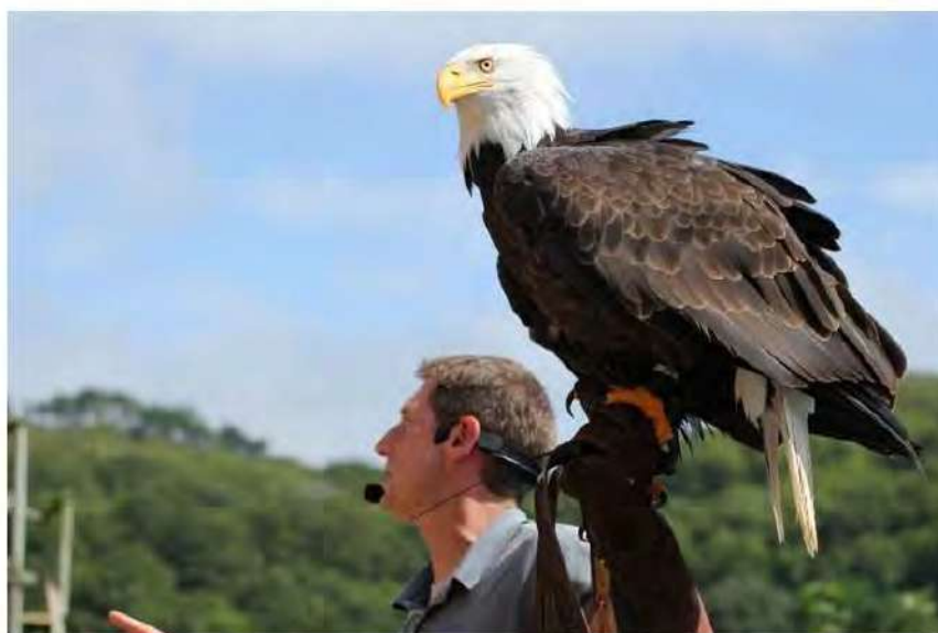
Un aigle pygargue à tête blanche d'Aud, basé dans un parc du Finistère, ne retrouve plus son chemin. Dana a parcouru la Bretagne et serait en Côtes d'Armor où elle a été aperçue.

Un aigle, basé dans un parc du Finistère, en est parti le 26 avril et ne retrouve plus son chemin. Dana a parcouru la Bretagne et serait en Côtes d'Armor où elle a été identifiée.