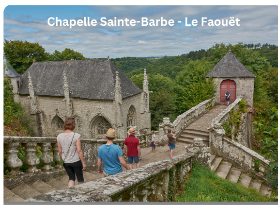
Chapelle Sainte-Barbe - Le Faouët