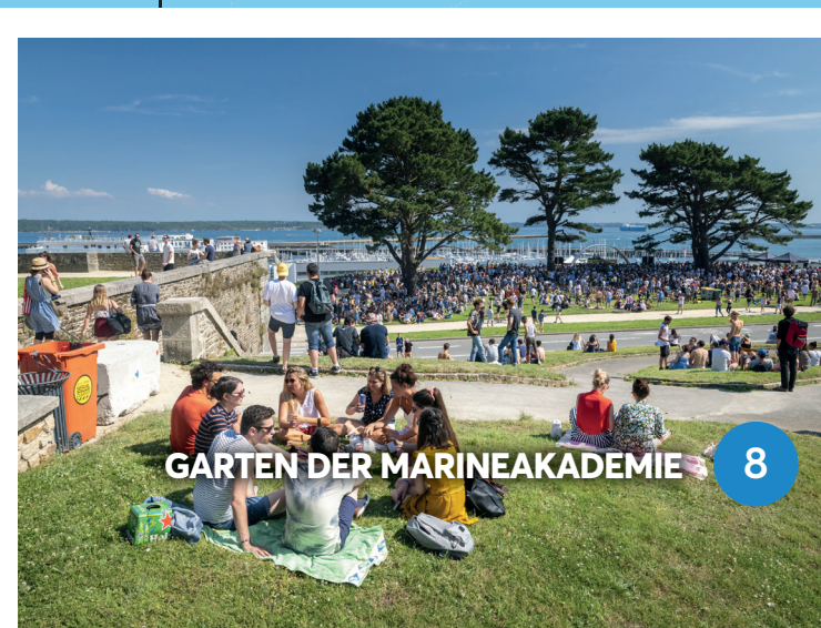
GARTEN DER MARINEAKADEMIE 8