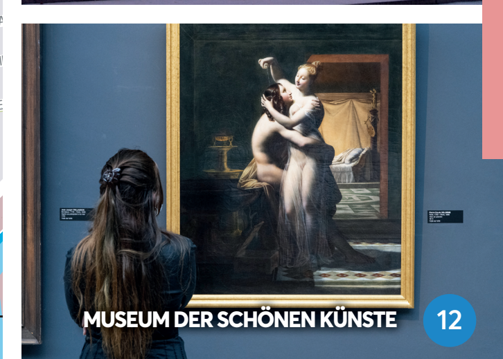
MUSEUM DER SCHÖNEN KÜNSTE 12