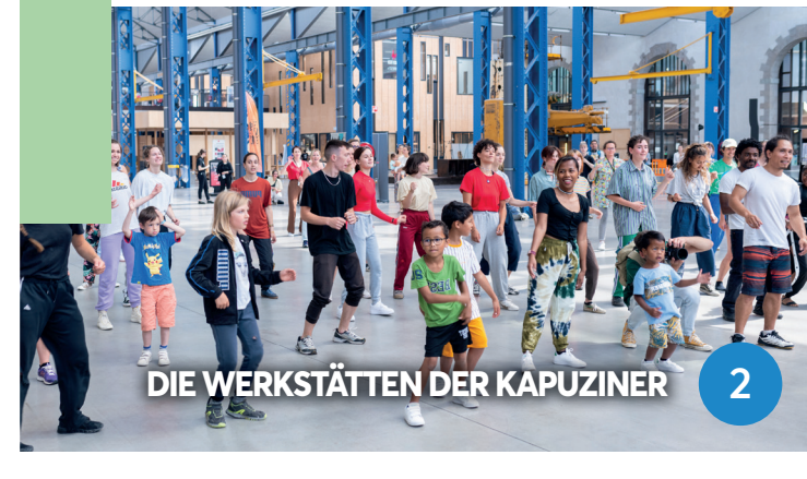
DIE WERKSTÄTTEN DER KAPUZINER 2