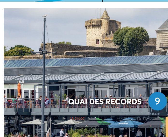
QUAI DES RECORDS 9