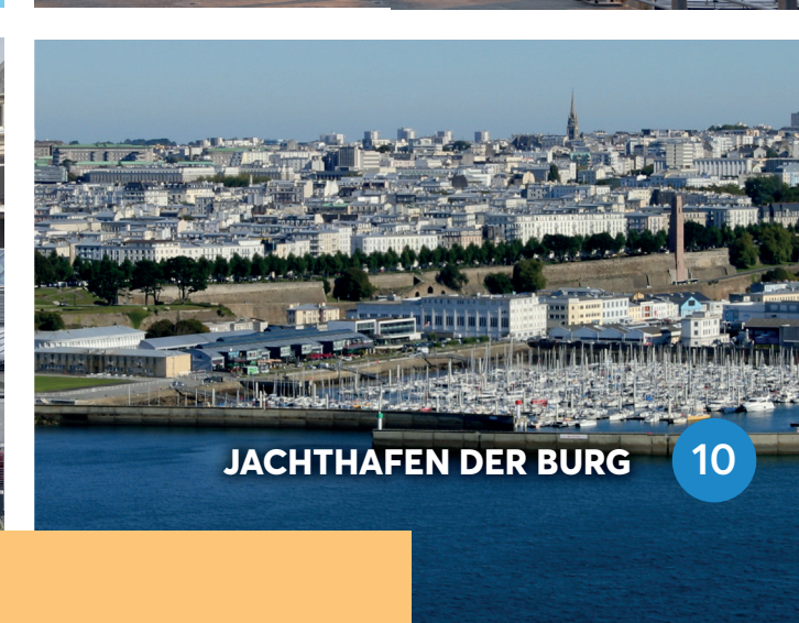
JACHTHAFEN DER BURG 10

SEPTEMBER BIS JUNI Montag bis Samstag : 9:30 - 18:00 Am Dienstag : 10:00 - 18:00 An Ostermontag und Pfingstmontag : 10:00 - 13:00 An 08/05 und Chinet Himmelfahrt : 10:00 - 17:00 An Ostern und Chinet Himmelfahrt : 10:00 - 17:00 und 01/01 JULI UND AUGUST Montag bis Samstag : 9:30 - 19:00 Am 15/08 : 9:30 - 19:00 Am Sonntag : 9:30 - 20:00 18jährig : 9:30 - 20:00