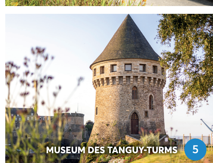
MUSEUM DES TANGUY-TURMS 5