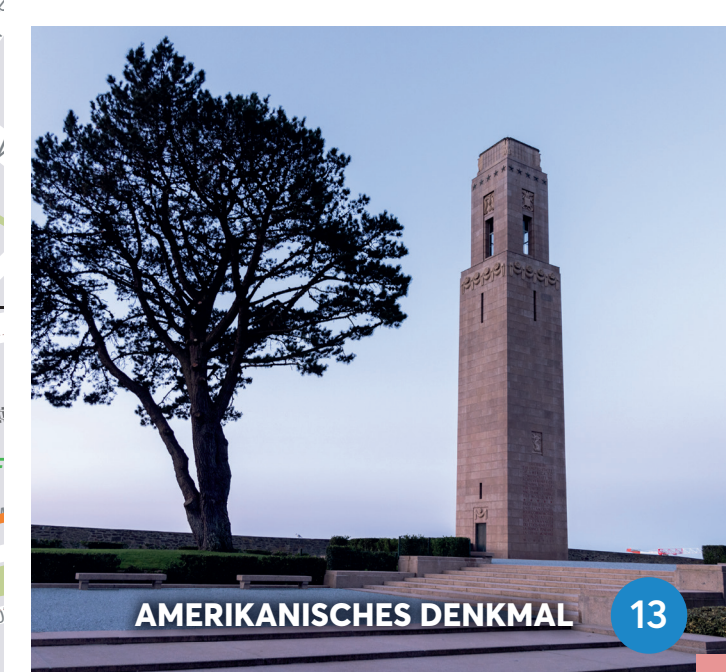
AMERIKANISCHES DENKMAL 13