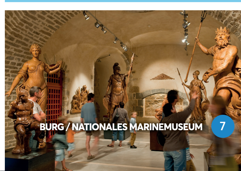
BURG / NATIONALES MARINEMUSEUM 7