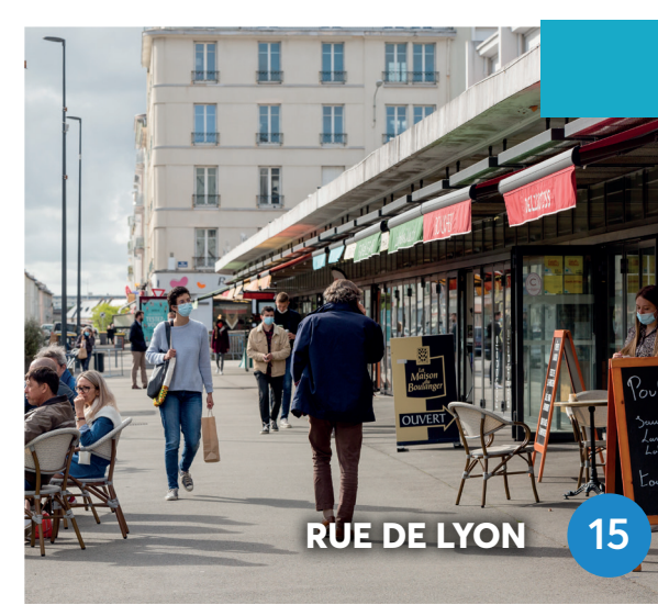
RUE DE LYON 15