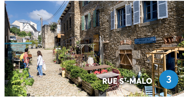
RUE S'-MALO 3