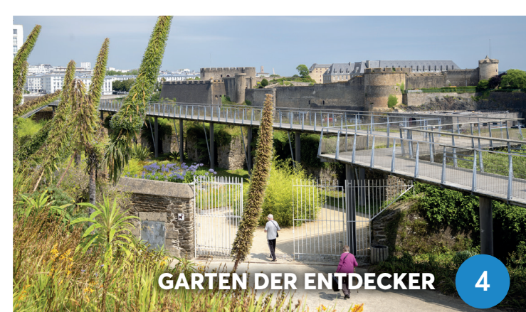
GARTEN DER ENTDECKER 4