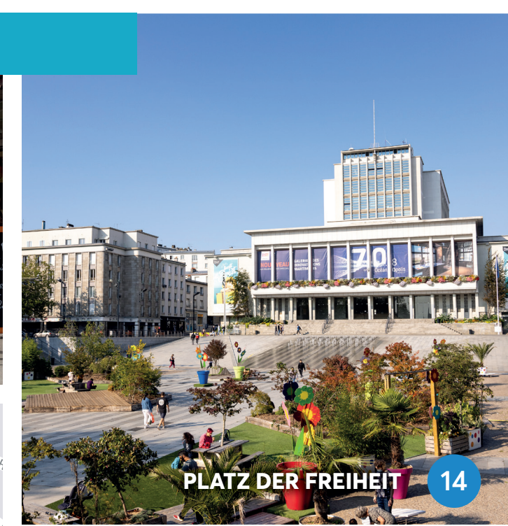
PLATZ DER FREIHEIT 14