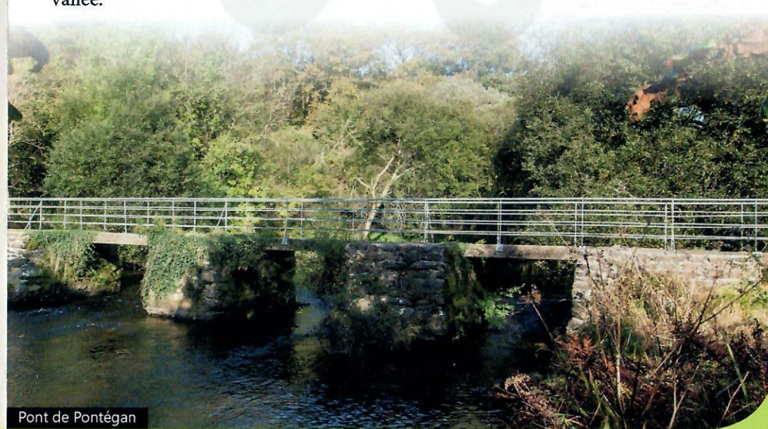
Pont de Pontégan

Remonter vers le parking de Kergoz en empruntant le chemin qui serpente à flanc de vallée.