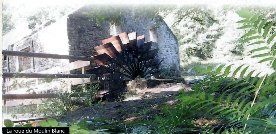
La roue du Moulin Blanc

Le nom Randofiche® est une marque déposée, nul ne peut l'utiliser sans l'autorisation de la Fédération française de la randonnée pédestre. © FFRandonnée - Avril 2018 - Document édité par le comité départemental du Finistère, BP2-29810 PLOUARZEL www.ffrandonnee29.fr