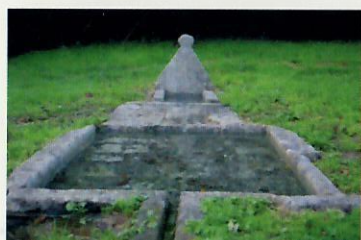
Lavoir et fontaine de Catélouarn