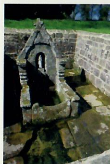
Fontaine de La Clarté