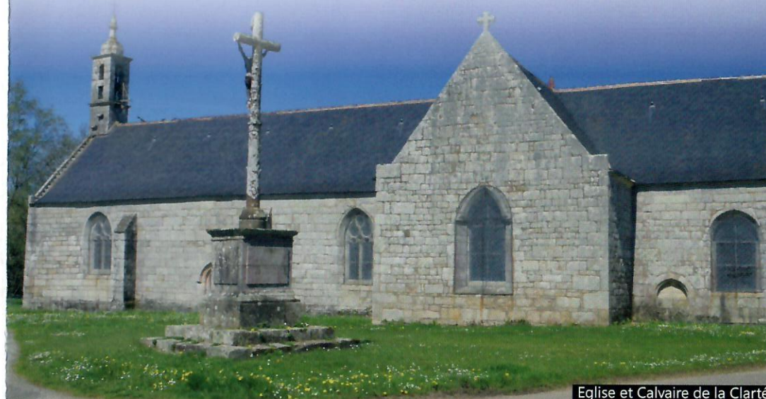
Eglise et Calvaire de la Clarté

RFN297-22 - Le nom Randofiche® est une marque déposée, nul ne peut l'utiliser sans l'autorisation de la Fédération française de la randonnée pédestre. © FFRandonnée Mai 2019 document édité par le comité départemental du Finistère, BP2-29810 PLOUARZEL www.ffrandonnee29.fr