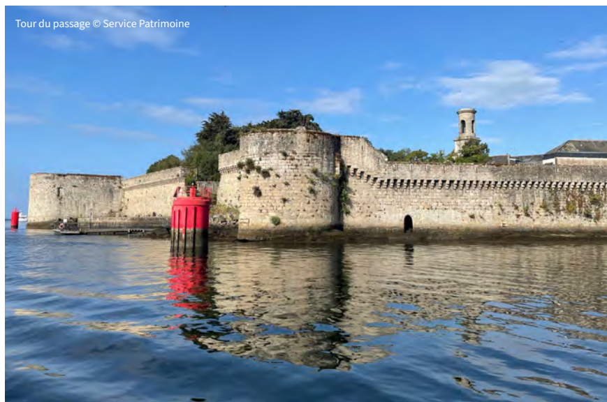
Tour du passage

Partez en balade hors de la Ville-Close sur les traces des premières constructions érigées hors les murs. Découvrez comment la ville s'est développée en lien avec le port, tandis que la vie maritime façonnait les quartiers. Au cours de cette exploration, vous entendrez parler de la Chapelle de La Croix, de la Station de biologie marine, ainsi que des quais Russe et Nul. Ensuite, nous nous intéresserons aux vestiges des conserveries encore présents, jusqu'à la discrète cheminée d'usine du Centre des Arts et de la Culture.