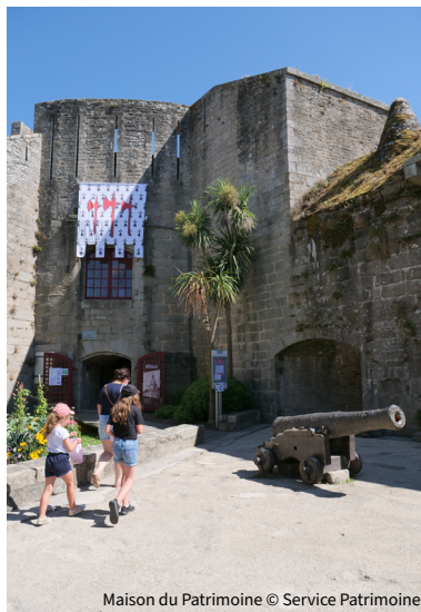
Maison du Patrimoine

Billetterie : en ligne sur : billetterie-mp.concarneau.fr ou à la Maison du Patrimoine