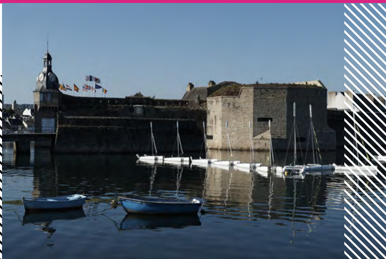
Entrée de la Ville-Close vue depuis le quai Pénéroff