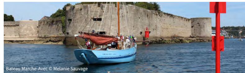
Bateau Marche-Avec © Melanie Sauvage