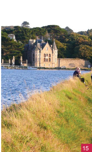
14. La villa Saint-Luc / 15. Le château du Laber en arrière-plan

de plus de huit cents espèces d'algues différentes, une biodiversité remarquable qui enrichit la qualité de l'eau.