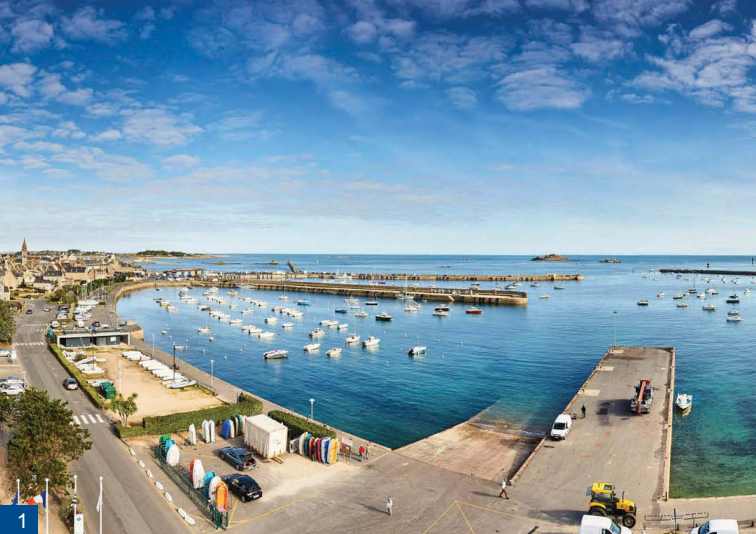
1. Le port, dans l'anse du Quellen