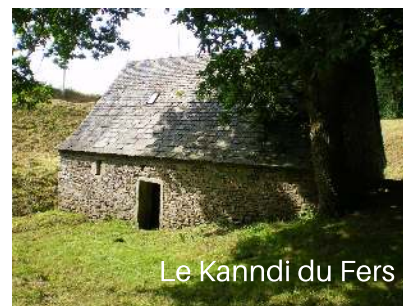
Le Kanndi du Fers

Télécharger la trace gpx de votre parcours